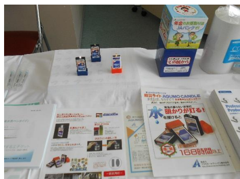
国際紙パルプ商事(株) 災害用LEDライト