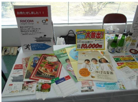
日本紙パルプ商事(株) 合成紙「ユポ」のサンプル商品展示、多くのお客様の関心を集めておりました