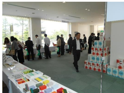
昨年以上にご来場のお客様でにぎわいをみせておりました