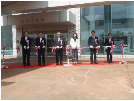
開会のテープカット